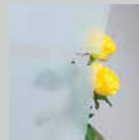
Szkoło ze wzorem